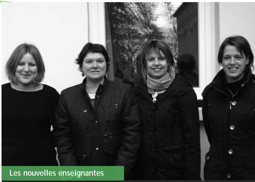
Les nouvelles enseignantes