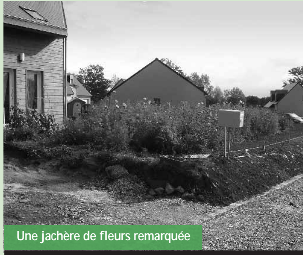
Une jachère de fleurs remarquable