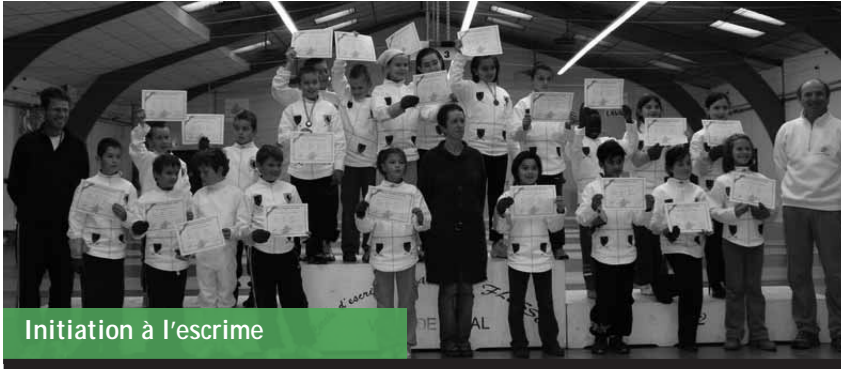
Initiation à l'escrime