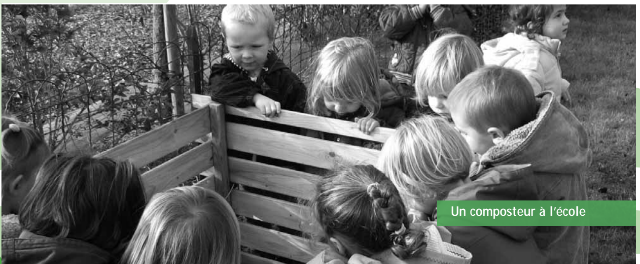
Un composteur à l'école