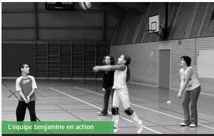
L'équipe benjamine en action