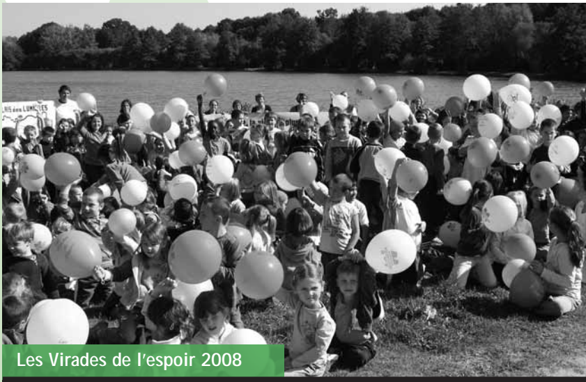
Les Virades de l'espoir 2008

7 rue des rochers 53210 Argentré Tel : 02 43 37 33 46 courriel : dauphins.ecole@wanadoo.fr