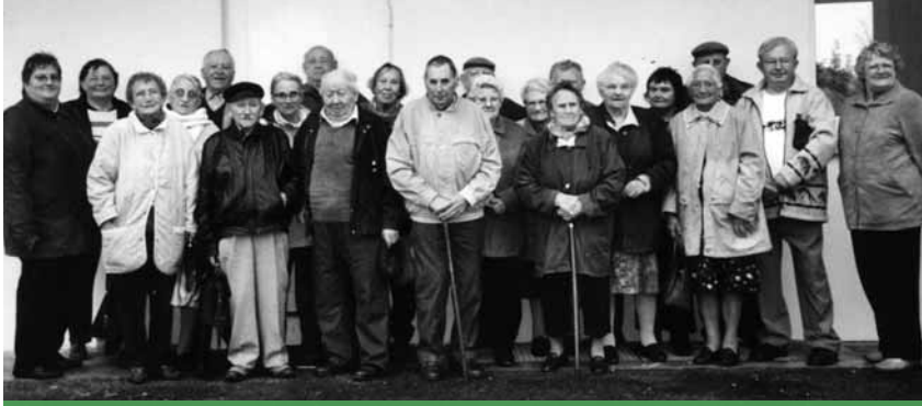
Les participants avant le départ pour la visite des jardins du château d'Hauterives

P ermettre aux bénévoles de développer le lien social, participer à la vie locale, rompre l'isolement des personnes aidées... autant d'objectifs atteints grâce à la réalisation d'actions collectives.