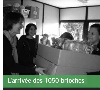
L'arrivée des 1050 brioches

C'est maintenant le rendez-vous attendu, la vente des brioches vendéennes avait lieu de fin septembre jusqu'à mi-octobre. Les brioches ont été distribuées avant les vacances de la Toussaint. Un grand merci à toutes les personnes qui ont participé et se sont mobilisées activement pour la réussite de cette opération avec une vente record de 1050 brioches. Les bénéfices ont servi à financer des équipements sportifs pour chaque classe et également des activités sportives telle que l'initiation escrime des CM. Les différents équipements ont été présentés aux parents lors de la soirée de Noël du 19 décembre.