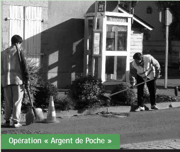
Opération « Argent de Poche »