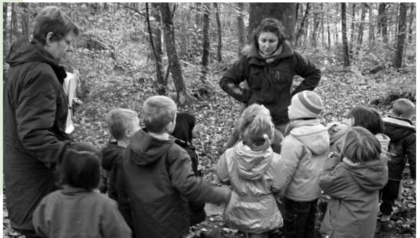
Un projet commun à toute l'école sur les petites bêtes et les arbres