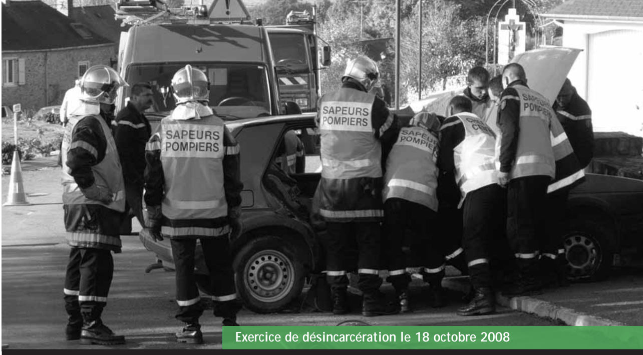
Exercice de désincarcération le 18 octobre 2008