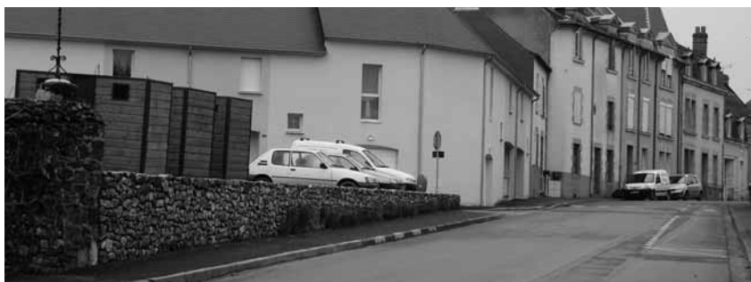
Des nouveaux conteneurs de tri sélectif à côté du cimetière

Responsable de publication : Christian Lefort Responsables de rédaction : Coralie Cavan et Sylvie Druet Création et impression : Imprim'Services Contacts : sylvie.druet@argentre.fr ou bulletin@argentre.fr