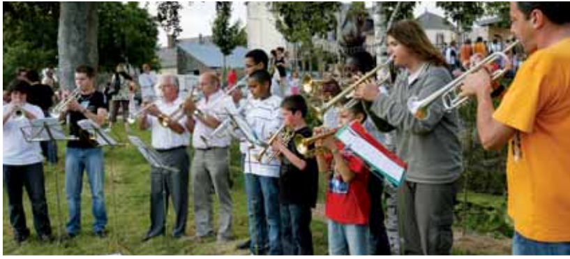
Fête de la musique le 28 juin 2008 à Argentré