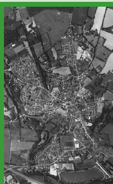
ARGENTRÉ VUE DU CIEL - 2006

ON CONSTATE EN FRANCE UN ÉTALEMENT URBAIN TRÈS PROBLÉMATIQUE : TOUS LES 10 ANS, L'ÉQUIVALENT D'UN DÉPARTEMENT FRANÇAIS DISPARÂT DES TERRES AGRICOLES ; BIEN SÛR, LES NOUVELLES ZONES D'HABITATIONS N'EN SONT PAS LA SEULE CAUSE - TOUTES LES NOUVELLES INFRASTRUCTURES (ROUTES, LGV, ZONES D'ACTIVITÉS) CONSOMMENT AUSSI BEAUCOUP D'ESPACES - MAIS ELLES Y CONTRIBUENT LARGEMENT ; DEPUIS ENVIRON 30-40 ANS, LA CONSOMMATION D'ESPACES POUR LES NOUVELLES HABITATIONS AUGMENTE 3 FOIS PLUS VITE QUE LE NOMBRE D'HABITANTS ! UN SIGNAL ALARMANT.