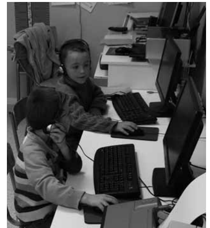
Des nouveaux ordinateurs pour apprendre autrement