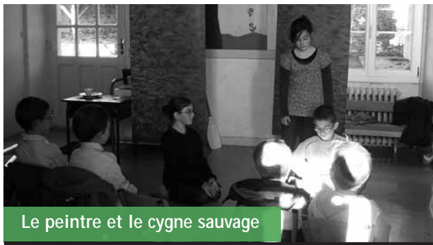
Le peintre et le cygne sauvage