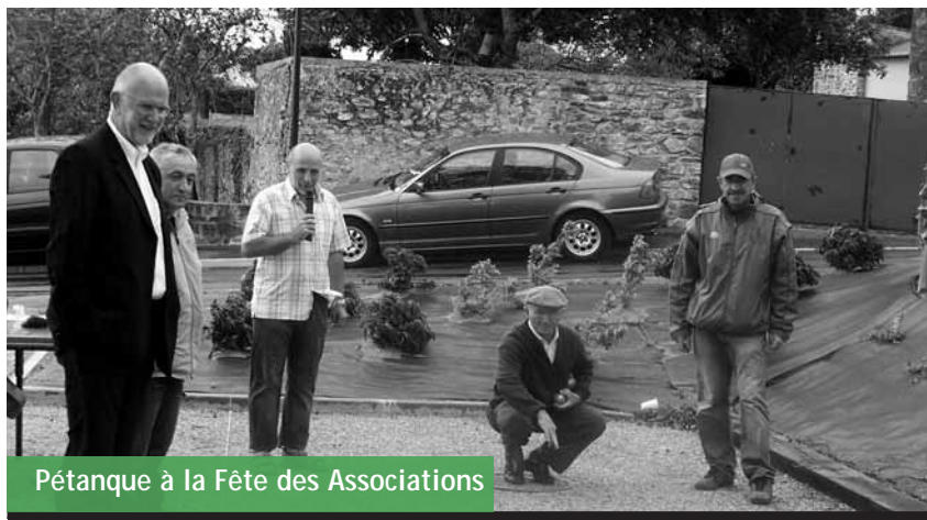
Pétanque à la Fête des Associations