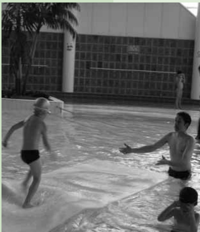
Des séances de piscine pour les enfants de grande section