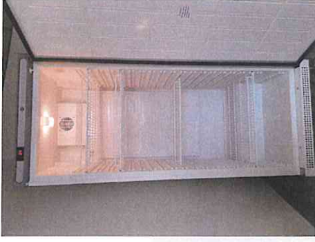
Hauteur-frigo-1m66 3 grilles 64cm*51cm 1 grille 64cm*33cm