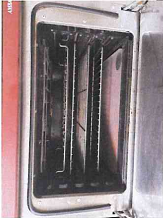
4 grilles 50cm*32cm Hauteur-four jusqu'à la résistance 28cm