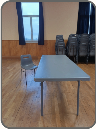
40 tables de 1m80*0.75 205 chaises