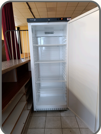
2 frigos de 1m65 en intérieurs 9 grilles au total de 50.5cm*64cm