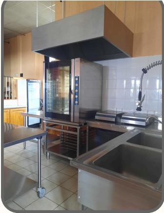
5 grilles 60cm*40cm Hauteur four : 93cm 10 étages - 6.5cm entre étages

Plans de projets soumis à une validation technique préalable