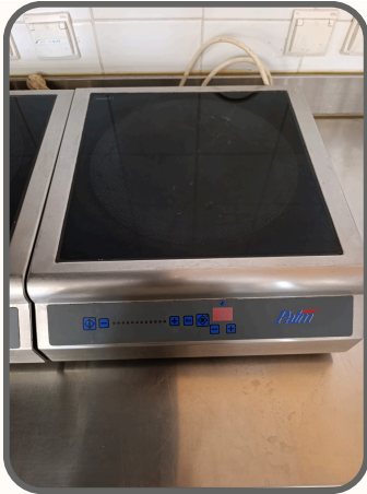
Plaques à induction 34cm*34cm